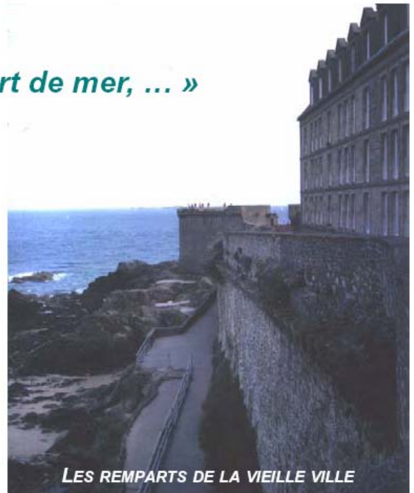
LES REMPARTS DE LA VIEILLE VILLE

C'est à la mer que la plupart d'entre eux doivent leur renommée. Dès le début du XVI e s., on constate la présence de Bretons dans les pêcheries sur les bancs de Terre-Neuve. En 1534, Jaques Cartier part à la recherche d'or dans la région de Terre-Neuve et d'un passage qui, l'espère-t-il, le conduira en Asie. Ces objectifs ne sont pas atteints, mais il prend possession d'un territoire nouveau qu'il nomme Canada (ce mot huron signifie village).