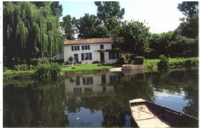
LA MAISON TRADITIONNELLE DU MARAÎCHIN

de transport habituel. On les manœuvre avec une gaffe, la « pigouille », ou avec une rame courte nommée « pelle ». Légères et effilées, les « yoles » servaient à aller au marché, à la messe, ou à conduire les enfants à l'école ; larges et massives, les « plates », utilisées pour le transport des récoltes ou du bétail, conviennent aussi au halage des billes de peupliers que, par flottage, on dirige vers les usines de contreplaqué de Niort et de St-Hilaire-la-Palud. » 3