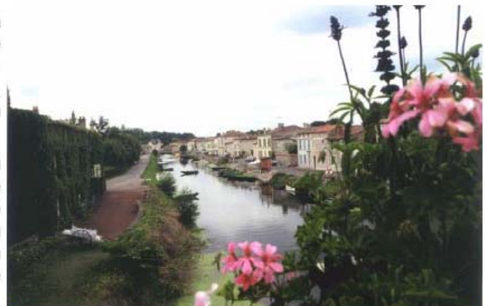
COULON S'ÉTIRE LE LONG DES RIVES DE LA SÈVRE NIORTAISE