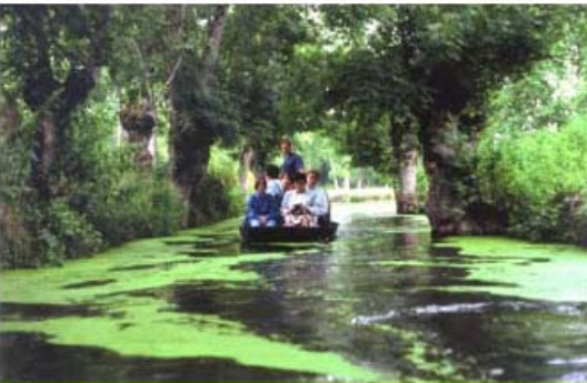
LE MARAIS POITEVIN EN BARQUE TRADITIONNELLE