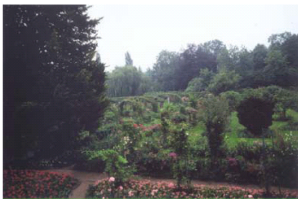
LES TONNELLES DU CLOS NORMAND

Ce jardin à la française, aux voûtes de plantes aériennes entourant d'éblouissants massifs, s'étire devant la maison et les ateliers. Entre les allées bien droites, on retrouve des fleurs aux multiples couleurs, telles que Monet les avait imaginées pour pouvoir peindre aussi bien les jours pluvieux que par beau temps. Les plantes annuelles alternent avec les vivaces de façon à maintenir une floraison constante. Selon la période de l'année, le jardin se pare de couleurs différentes. Il est tout à fait naturel de retrouver le jardin de Giverny dans plus de deux cent cinquante toiles. Les deux passions de l'artiste se trouvent ici réunies. Le jardinier préfigure le peintre. Monet lui-même ne disait-il pas : « En dehors de la peinture et du jardinage, je ne suis bon à rien. » 4